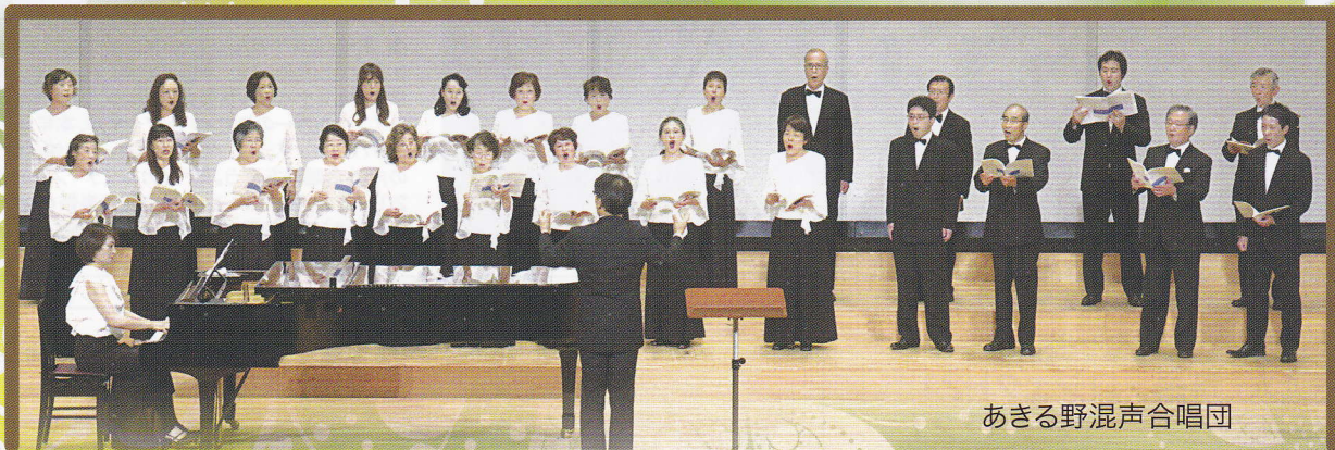
あきる野混声合唱団

主催：NPO法人 市民プロジェクト21 共催：秋川キララホール ※未就学児の入場はできません。