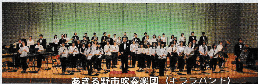
あきる野市吹奏楽団 (キララバンド)

あきる野市吹奏楽団は 1990 年に「秋川市青少年吹奏楽団」として発足し、1995 年あきる野市の誕生とともに「あきる野市吹奏楽団」と改称いたしました。愛称の「キララバンド」は、団の活動拠点となっている「秋川キララホール」からとられています。平成 25 年 4 月より、あきる野市の指定を受け、市のオフィシャルな吹奏楽団となりました。活動は、年 1 回の定期演奏会のほか、吹奏楽コンクールや市の主催事業への参加、あきる野市内でのイベント演奏など、年間 10 回を超える本番を行っています。