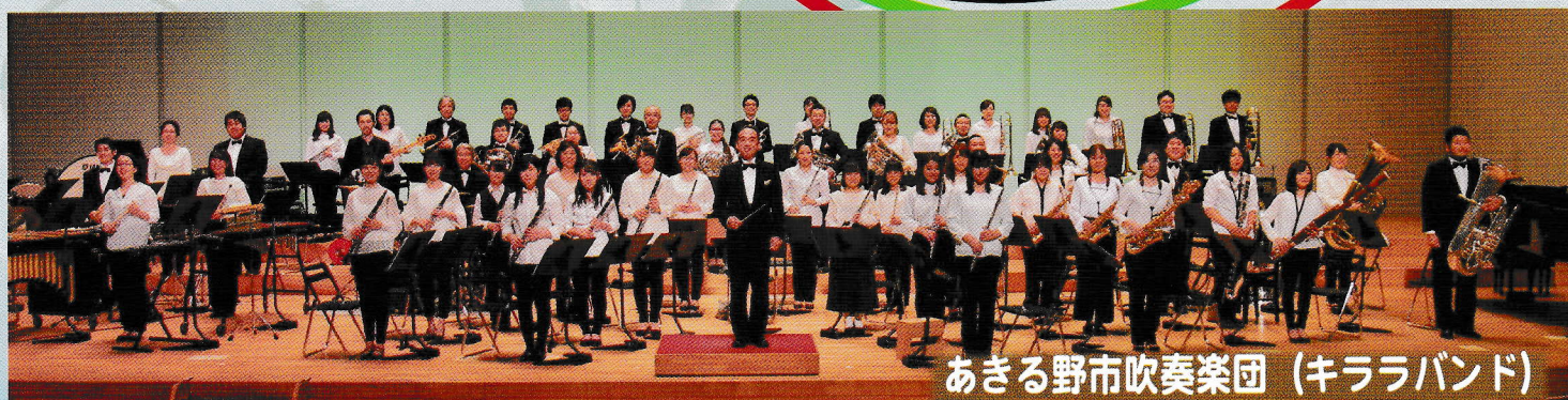
あきる野市吹奏楽団 (キララバンド)

■ 問合せ: NPO 法人・市民プロジェクト 21/TEL 042-550-3721 ■ チケット: 秋川キララホール/TEL 042-559-7500